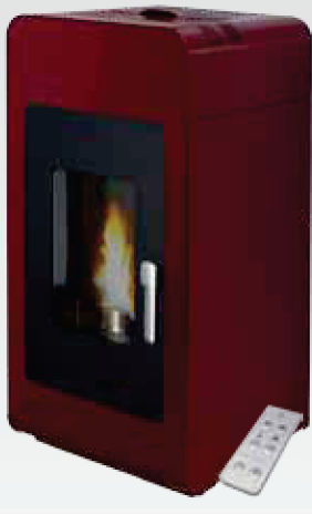
Solius Sintra hidro | Bordeaux ou Marfim