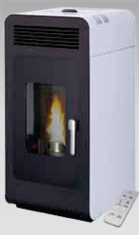
Solius Sintra ar quente | Marfim ou Bordeaux