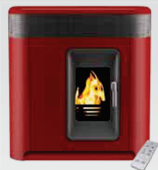
Solius Arrábida Vermelha