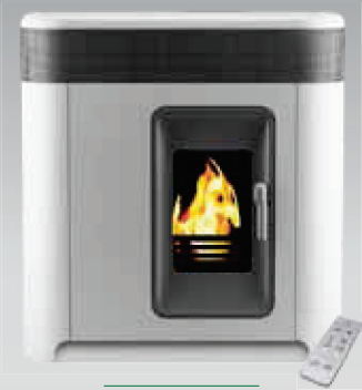
Solius Arrábida Branca